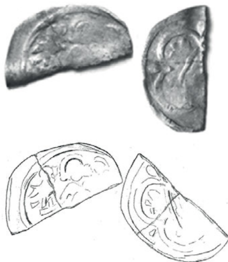
Ryc. 2. Międzyrzecz. Denar Da. 111/Bft 565

Av. Stojąca na wprost postać z rozłożonymi rękoma. Nad każdą dłonią orzeł (lub sokół) skierowany głową do wewnątrz. Poniżej po jednym hełmie z orlim skrzydłem, również każdy skierowany ku postaci. Przy krawędzi obwódka liniowa odbita na całym obwodzie połówki. Stempel lekko przesunięty. Pęknięcie w poprzek połówki. Stempel dosyć słabo czytelny. Cięcie nastąpiło w poprzek postaci.