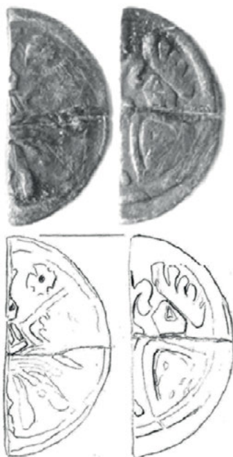
Ryc. 3. Międzyrzecz. Denar Da. 113/Bft 571

Z fotografii można odczytać, że przepołowienie nastąpiło w wyniku regularnego przecięcia. Monetę przelamano z pewnością po odkryciu.