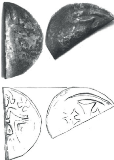
Ryc. 4. Międzyrzecz. Denar Da. 127/Bft 572

centralnego krzyża. Stempel lekko przesunięty. Przykrawędna obwódka liniowa odbita na połowie przedzielonego denara.