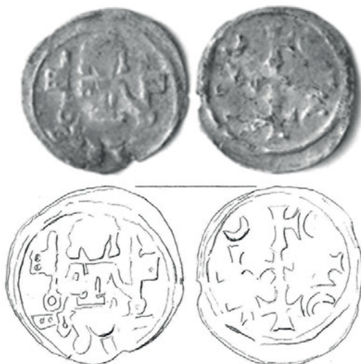
Ryc. 1. Międzyrzecz. Denar Da. 79/Bft 339

1. Marchia Brandenburska, dynastia askańska, denar, ok. 1275 r. (ryc. 1) Da. 79 (ok. 1275)/Bft 339