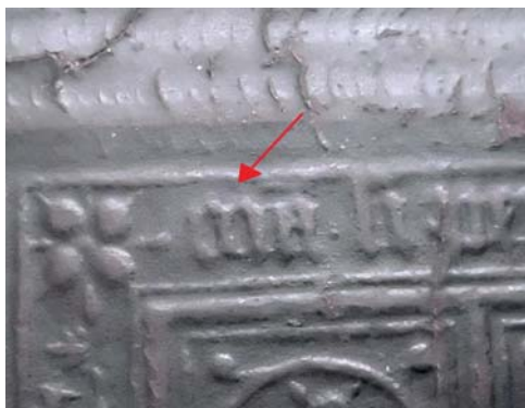
Il. 5d. Tylna okładzina druku sygn. 14372 z zaznaczonym okrągłym śladem wyróżniającym plakię Geraerta van der Hatarta.