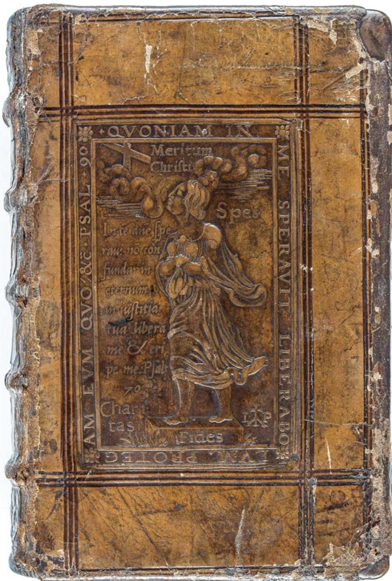
Il. 1a. Mistrz IP, oprawa druku sygn. 155247 – okładzina górna.