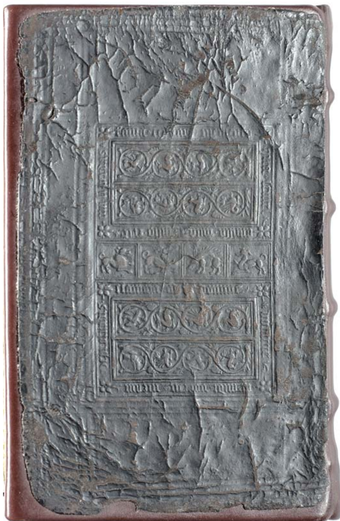
Il. 2b. Introligator anonimowy, oprawa druku sygn. 14372 – okładzina dolna.