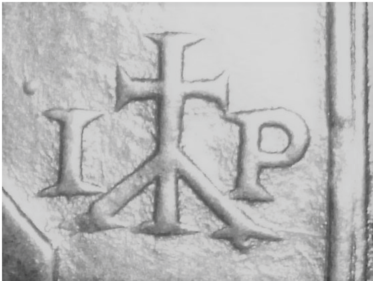
Il. 4. Gmerk Mistrza IP, sygn. 155247.