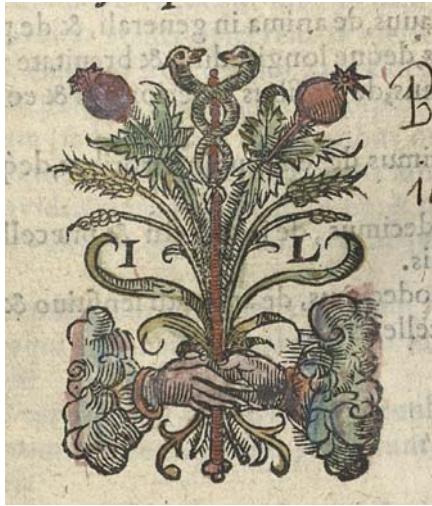
Il. 3. Kolorowany sygnet drukarski Jeana Loysa alias Louisa de Tielt, sygn. 155247.