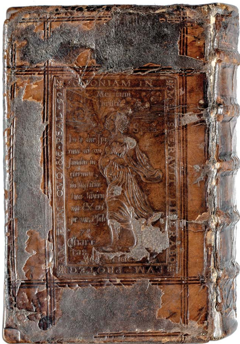
Il. 1b. Mistrz IP, oprawa druku sygn. 155247 – okładzina dolna.