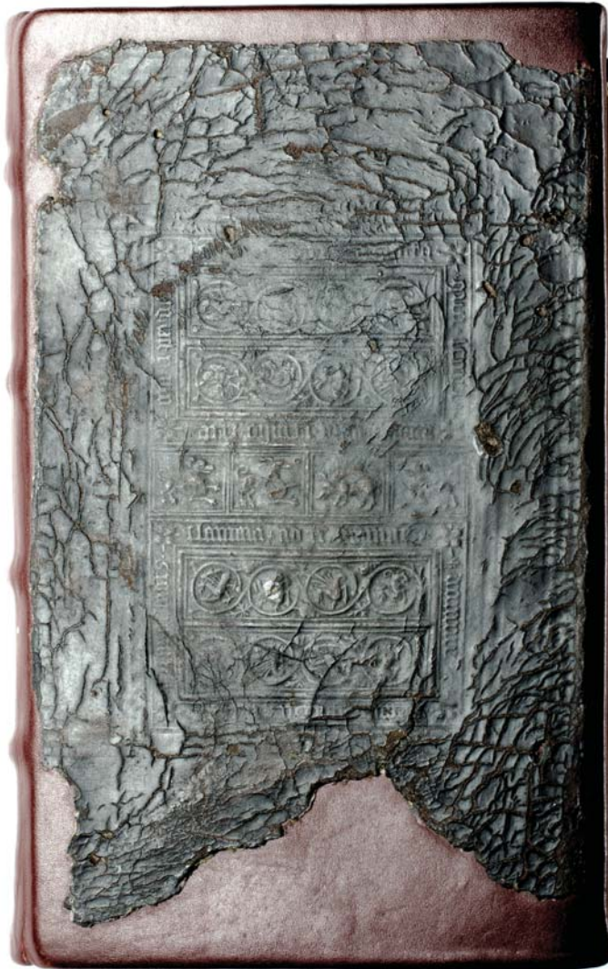
Il. 2a. Introligator anonimowy, oprawa druku sygn. 14372 – okładzina górna.