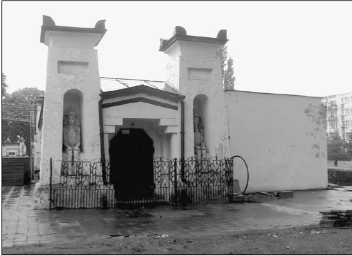
Końskie, Oranżeria Egipska. Pylon od strony wschodniej. Fot. J. Śliwa, 2006

czonymi powyżej 23 . Pomiedzy opisanymi wieżami-pylonami od strony wschodniej usytuowano rodzaj klasycystycznego portyku z trójkątnym przyczółkiem (portyk ten osłaniał dodatkowo, boczne wejście do oranżerii).