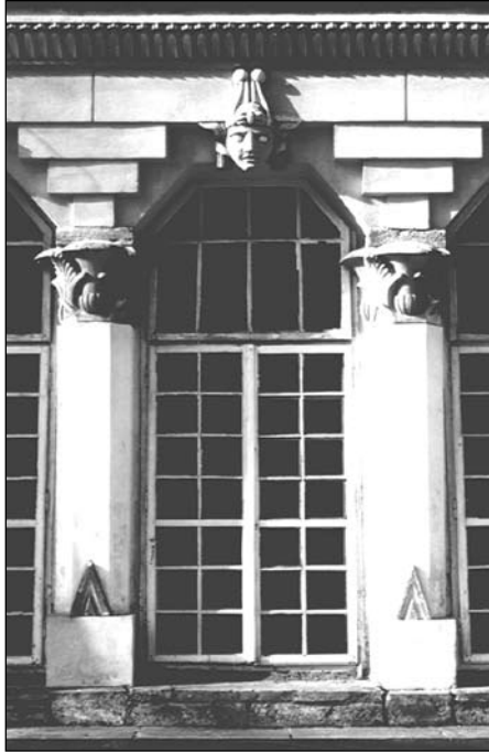
Końskie, Oranżeria Egipska. Egipsyzujące półkolumny i belkowanie galerii południowej.

wyżej – odwrócona piramida schodkowa, złożona z trzech elementów. Na takiej konstrukcji wspierają się belki architrawu (łączenia bloków wypadają dokładnie na osiach kolumn) zwieńczone gzymsem cavetto ze stylizowanymi ureuszami 29 . Półkolumny południowej galerii łączone są rodzajem arkadowych pseudo-łuków (z ostrymi załamaniem), a w miejscu zworników umieszczono oryginalnie ukształtowane maski, wywodzące się ze specyficznej formy egipskich kapiteli hatoryckich 30 .