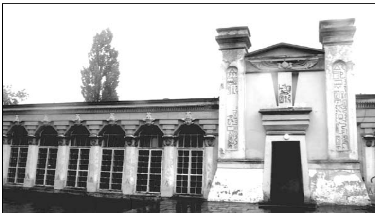
Końskie, Oranżeria Egipska. Wejście główne w elewacji południowej oraz fragment kolumnady. Fot. J. Śliwa, 2006

umieszczono charakterystyczne torusy oraz gzymсы cavetto , natomiast ich zamknięcie od góry stanowią niskie namiotowe nakrycia. Na frontowych powierzchniach obu wież, w łukowato zwieńczonych wgłębieniach, umieszczono szereg pseudohieroglificznych znaków, bardzo odległych od swych starożytnych pierwowzorów. Właściwe wejście do oranżerii, prostokątne, lekko zwężające się ku górze, usytuowane jest pomiędzy wspomnianymi ryzalitami. Jego obramowanie zwieńczone jest mocno ku górze rozbudowanym gzymsem złożonym z torusów i cavetta . Pionowy „blok” (pokryty pseudohieroglifami) umieszczony na osi symetrii otworu wejściowego, ponad gzymsem, stanowi łącznik z przyczółkiem ozdobionym uskrzydłonym dyskiem słonecznym.