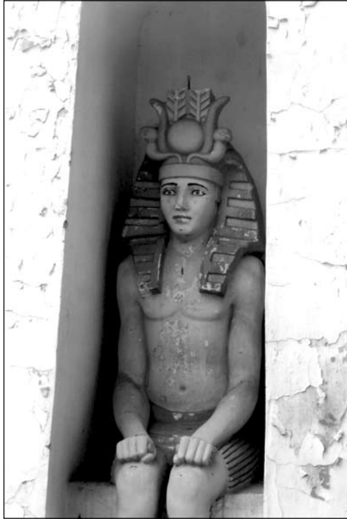
Końskie, Oranżeria Egipska. Posąg faraona-Memnona w jednej z nisz pylonu wschodniego. Fot. J. Śliwa, 2006

Narożniki oranżerii wzmocnione zostały masywnymi wieżami-pylonami wysokości 4,75 m, w których zarówno od strony wschodniej, jak i zachodniej, w głębokich niszach posadowiono monumentalne posągi siedzących faraonów-Memnonów 20 . We wgłębieniach na ścianach pylonów od strony południowej i północnej naniesione zostały ciągi pseudohieroglifów 21 . Pylony zwieńczone zostały charakterystycznymi dla egipskiej architektury gzymsami cavetto 22 oraz „zębatymi” narożnikami umiesz-