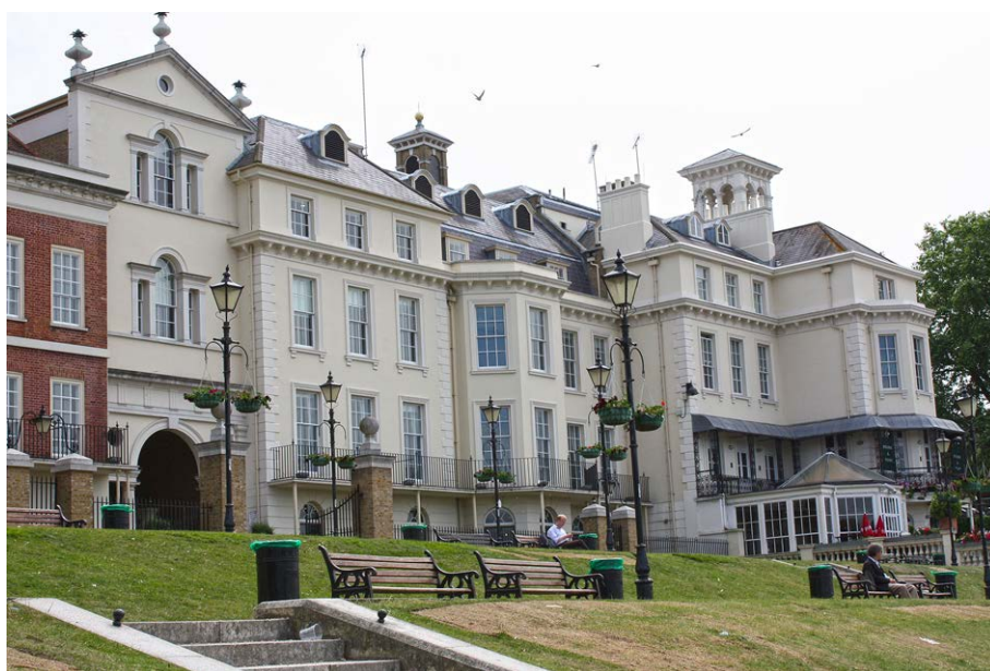
Fot. 3. Widok od strony Tamizy z widocznym na pierwszym planie wzgórzem tarasowo opadającym w stronę rzeki

stopy kwadratowej wyniósł 80 funtów, w porównaniu do 100 funtów za normalną, klimatyzowaną przestrzeń biurową w tym samym czasie w Londynie. Co więcej, większość nowoczesnych biur jest budowana na trzydzieści lat, ale tradycyjne budynki Terry'ego będą trwałe przez pokolenia” [Watkin 2006, s. 29]. Wszystko to wskazuje, że rozwiązania stosowane przez Nowych Klasycystów powinny być brane pod rozwagę także z tych względów.