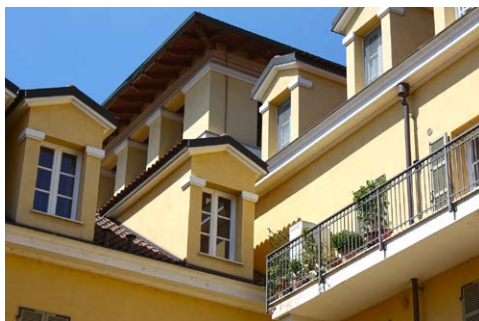
Fot. 9. Città Nuova w Alessandrii, elementy architektoniczne nawiązujące do kultury regionalnej