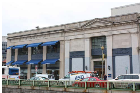
Fot. 10. Paul Cushman III International Financial Center, Dupont Circle, Waszyngton, 1989-2000