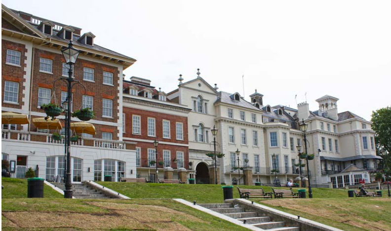
Fot. 1. Richmon Riverside, 1984-87. Zabudowa od strony Tamizy. Budynki o różnorodnym charakterze tworzą całość, opartą na osiemnastowiecznej teorii malowniczości

Jako pierwsza zostanie omówiona rewitalizacja kwartału miejskiego nad Tamizą w miejscowości Richmond-on-Thames, w aglomeracji Wielkiego Londynu . Od lat 70. był to zdegradowany fragment miasta, dzisiaj reklamuje się jako znakomite miejsce do pracy i kwitnące środowisko życia, łączące ze sobą restauracje i bary, sklepy, biura i mieszkania. Zanim ostatecznie zatrudniono Quinlana Terry, kilku deweloperów i architektów próbowało rozwiązać problem. Jednak dopiero propozycja angielskiego Nowego Klasycysty zyskała aprobatę Richmond Borough Council ze względu na skromną skalę i zróżnicowaną architekturę sympatyzującą z historycznym centrum miasta [Watkin 2006, s. 24].