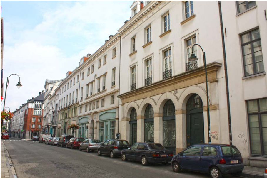
Fot. 4. Rewitalizacja Rue de Laeken w Brukseli, 1989-1995