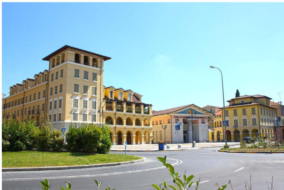
Fot. 7. Città Nuova w Alessandrii. Widok ogólny z placem centralnym, 1995-2008

Kolejną realizacją, którą chciałbym omówić jest przebudowa kwartału miejskiego miasta Alessandria w północnych Włoszech . Projekt Città Nuova był przebudową działki po byłej fabryce Olva. Istotą koncepcji było stworzenie ważnego, centralnego placu w dzielnicy Pista w stolicy jednej z piemonckich prowincji, w celu wkomponowania istniejącego kościoła Madonna del Suffragio w obręb projektu i podkreślenia jego znaczenia i widoczności przez dobudowanie dzwonnicy. Jak pisze Krier współtwórca projektu: „Città Nuova jest nie tylko zwykłą przebudową ze zmianą funkcji typowego, liczącego 100x100 metrów kwartału, lecz stwarza dzielnicę, wreszcie wyposażoną w plac centralny jako symboliczne, funkcjonalne i społeczne centrum miasta. Cztery nowe kwartały tworzą zróżnicowane, charakterystyczne przestrzenie publiczne, dobrze współgrające z istniejącym otoczeniem [Krier 2011, s. 365].