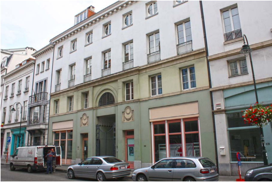
Fot. 5. Rewitalizacja Rue de Laeken. Widoczne zróżnicowanie stylistyczne poszczególnych elementów кварталу