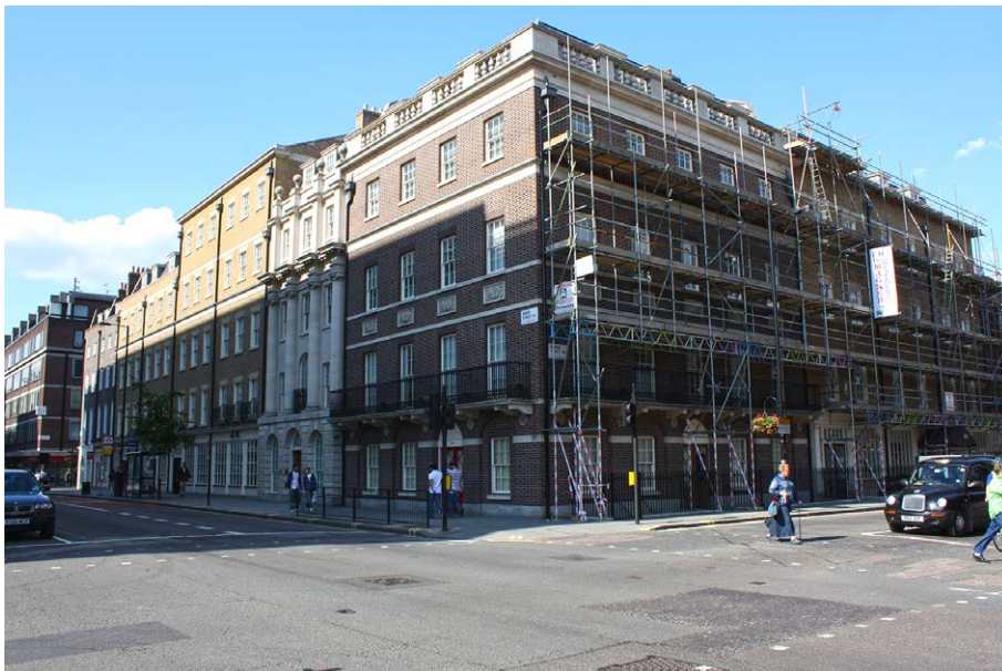
Fot. 11. Rewitalizacja Baker Street, Kendall Place i George Street w Londynie, 2001-2002

i restaurację, na wyższych piętrach przestrzeń biurowe o otwartym planie otaczające duże atrium. Zróżnicowane w formie materiale i kolorystyce założenie, znakomicie wpisuje się w historyczną tkankę europejskiego miasta.