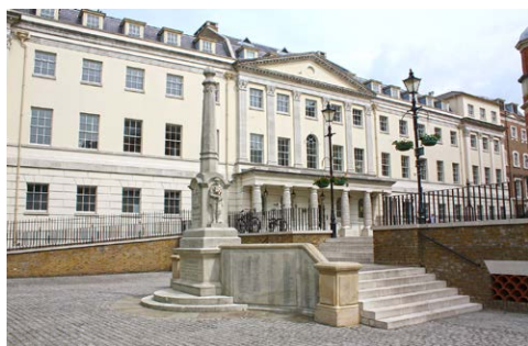
Fot. 2. Widok Richmond Riverside od strony Hill Street; narożnika Hill Street i Bridge Street; Bridge Street; Whittaker Building

Całość założenia jest świetnie połączona z brzegiem Tamizy, do którego prowadzi lekkie zbocze. Wykorzystano je tworząc tarasy oddzielone alejkami, które, od strony Whittaker Building i restauracji Revolution, tworzą zygzakowaty kształt (rampy dla osób niepełnosprawnych). Podczas ciepłych, wiosennych i letnich dni miejsce stanowi punkt spotkań wielu osób. Cieszy się wielką popularnością, co świadczy o sukcesie rewitalizacyjnym, tego pierwszego założenia opartego na zasadach Nowego Klasycyzmu .