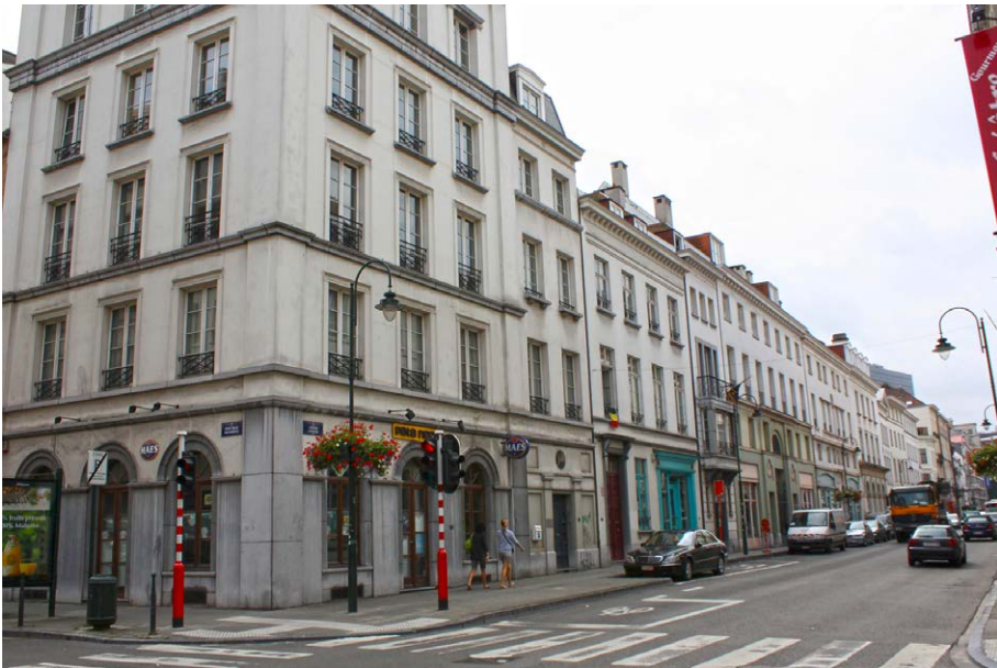
Fot. 6. Narożnik Rue du Pont Neuf i Rue de Laeken