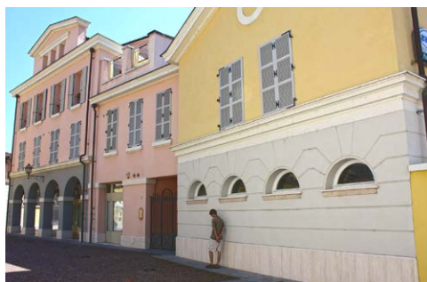
Fot. 8. Zabudowa kwartału Città Nuova w Alessandrii

Zabudowa nie ma charakteru regularnego, opartego na prostopadłej siatce ulic. Główny plac przybiera kształt nieregularny, a wewnętrzne uliczki nie są poprowadzone w linii prostej. Zwornikiem całego założenia jest budynek banku, który choć niezbyt duży, charakteryzuje się monumentalnością. Bryły innych budynków, zróżnicowane wysokością, wielkością oraz kształtami tworzą wraz z wewnętrznymi dziedzińcami i ogrodami malowniczą całość. Dzięki takiemu rozwiązaniu większość użytkowników lokali otrzymała interesujące widoki, ale także dobre doświetlenie wnętrza i odpowiednią wentylację pomieszczeń. Górne kondygnacje budynków zaopatrzone są w belwedery, loggie, czy pergole. Podziemne garaże, których rampy zintegrowane są z bryłami budynków powodują, że samochody nie stają się częścią miejskiej zabudowy. Kiedy miałem okazję odwiedzić to miejsce, w obrębie zaprojektowanego kwartału nie widziałem ani jednego pojazdu. Samochody stały jedynie przy zewnętrznych ulicach otaczających.