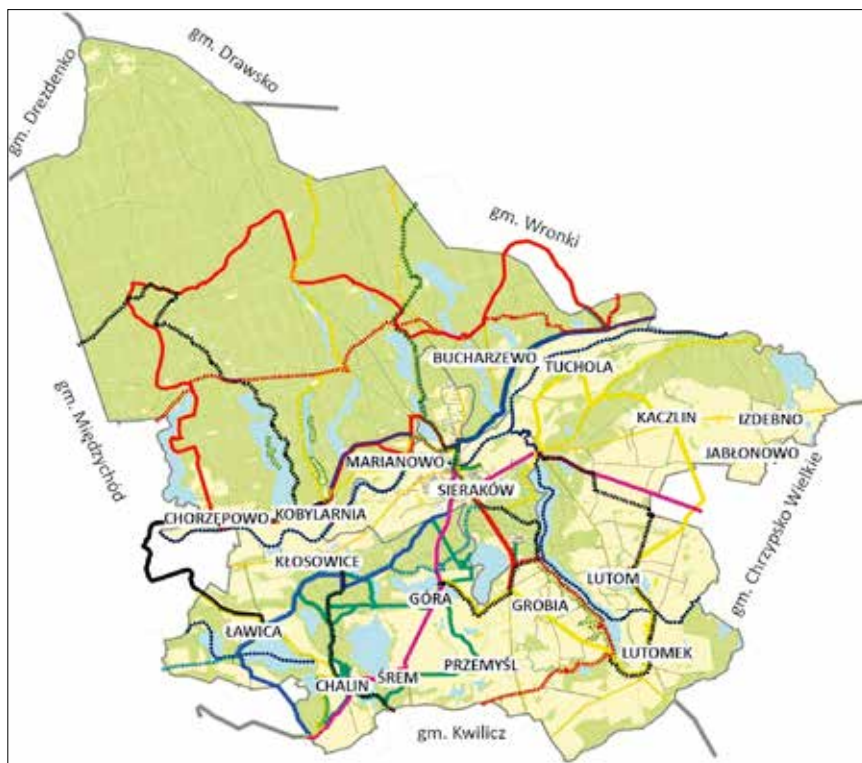
Ryc. 1. Szlaki turystyczne w gminie Sieraków

ich łączna długość to ok. 200 km. Ważnym węzłem tych szlaków jest Sieraków oraz położony w południowo-zachodniej części gminy Chalin (ryc. 1).