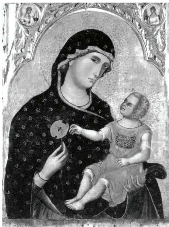
Ryc. 3. Paolo Veneziano, Madonna z makiem, ok. 1325 r., San Pantalon, Wenecja . 2. Obraz przedstawia Madonnę z dzieciątkiem. Maryja trzyma w dłoni kwiat maku, symbol męki Jezusa. Widać jak Matka Boska gestem chce oddalić kwiat od swojego syna.