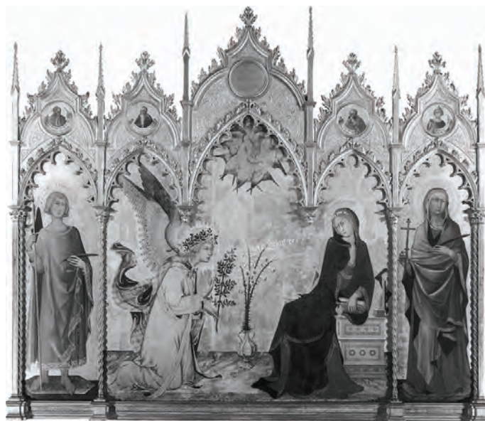
Ryc. 2. Martini Simone, Memmi Lippo, Zwiastowanie, 1333 r., Galeria Uffizi, Florencja, źródło: http. 1 . W tle widoczny jest kwiat lili, który symbolizował czystość i dziewictwo Maryi Panny

W średniowiecznych ogrodach przyklasztornych rośliny stanowiły źródło pożywienia, pozyskiwania lekarstw. Równie cenne były ich walory ozdobne, a także bogata symbolika, którą wносиły do ogrodu. Dzięki kwiatom, ziołom czy drzewom, mnisi mogli odnaleźć w murach klasztornych część raju. Wirydarz zatem był swego rodzaju „wzorcem kosmicznym” czy „diagramem Raju”, który mogli kontemplować zakonnicy 28 .