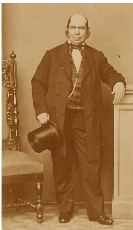
7. Wilhelm Ferdinand Zerneck (1790–1859) (PAN Biblioteka Gdańska, fot. Biblioteka)