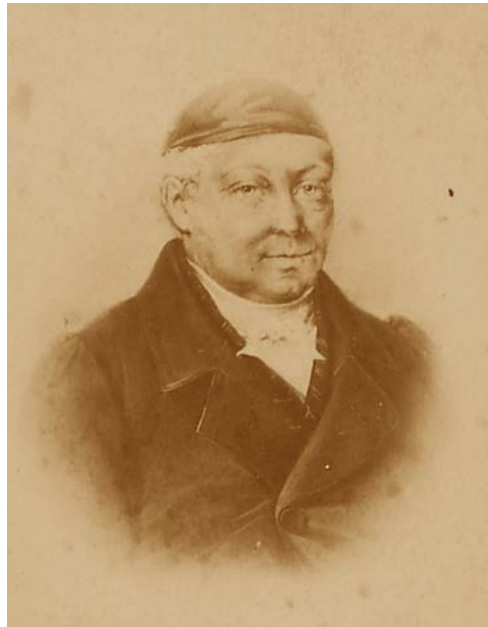
5. Daniel Gottfried Zerneck (1775–1847)