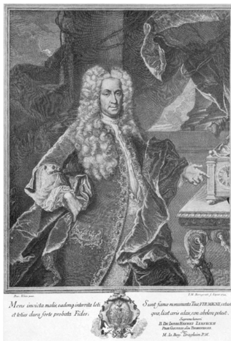
2. Jacob Heinrich Zernecke (1672–1741)