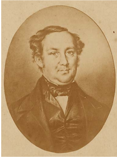
8. Heinrich Wilhelm Zernecke (1802–1858)