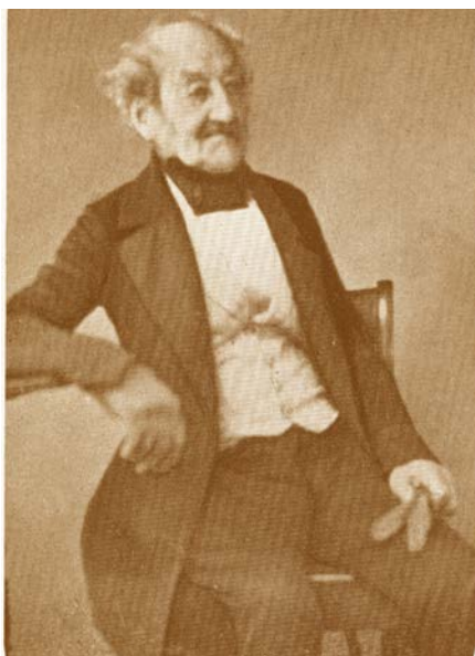
6. Johann Samuel Zerneck (1778–1861)