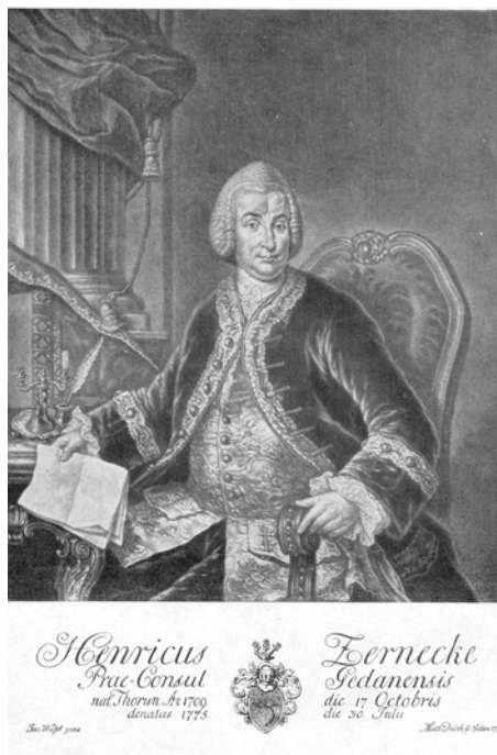
3. Heinrich Zernecke (1709–1772) (PAN Biblioteka Gdańska, fot. Biblioteka)