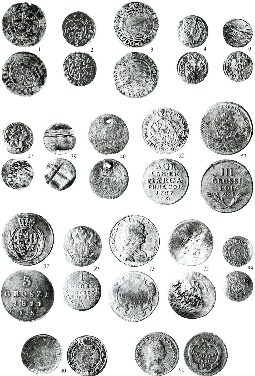
Tablica 1. Monety z kolekcji H. Łuszczynskiego.