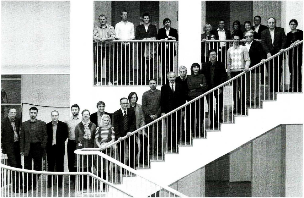
Ryc. 1. Uczestnicy sympozjum poświęconego numizmatyce orientalnej. Kopenhaga, 6 grudnia 2006 r.