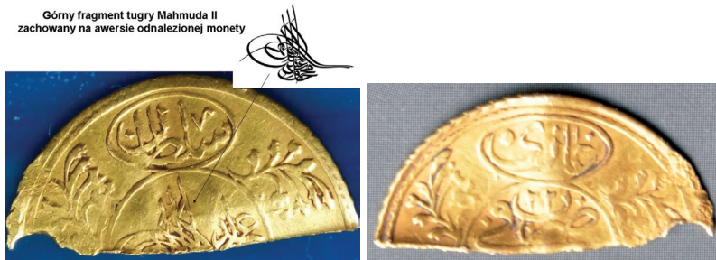
Ryc. 1. Kopce, pow. janowski. Moneta Mahmuda II

Waga ok. 0,7 g; średnica (osi poziomej) 21 mm (Pere 1968, s. 244, nr 746) 2 , próba według ordynacji 0,873 [?] (Pere 1968, s. 241, 243, nr 738, tab. 50) 3 . Zachowała się górna część monety, która w nieokreślonym czasie (przed czy po wywiezieniu z Imperium Osmańskiego?) uległa podziałowi. Moneta jest w dobrym stanie, drobne starcia awersu widać tylko przy krawędzi przecięcia. Dość regularna krawędź podziału wskazuje, że był on celowy. Przyczyna tego nie jest znana — czy zamierzano monetą jako kawałkiem złota obracać na rynku Królestwa Polskiego według wagi, czy miała posłużyć do przetopu 4 , czy też funkcjonować jako ozdoba. Na awersie monety widoczny jest ślad, być może po otworze, co nie pozwala wykluczyć, że monetę wykorzystywano jako ozdobę.