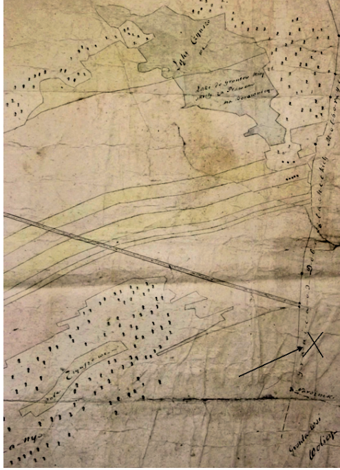
Ryc. 3. Pogranicze gruntów miasta Janowa i dóbr Modliborzycze ok. 1822 r. Pośrodku widoczny trakt z Janowa do Modliborzyc, po prawej zaś linia graniczna i punktowo zaznaczone nieopisane znaki graniczne (znakiem X oznaczono miejsce odnalezienia monety); Archiwum Państwowe w Lublinie, Archiwum Ordynacji Zamojskiej, Plany, nr 25.

Osadnictwa w okolicach obecnej miejscowości Kopce nie ma jeszcze na mapie kwatermistrzowskiej tzw. Nowej (Zachodniej) Galicji austriackiego płk. Antona barona Mayera von Heldensfelda, opracowanej w latach 1801–1804 według informacji zebranych w latach 1779–1783 i wydanej drukiem w 1808 r. 8 W epoce Królestwa Polskiego, a więc w czasie emisji odnalezionej monety osmańskiej, teren ten stanowił granicę dóbr Modliborzycze i Ordynacji Zamojskiej (grunta ówczesnego miasta Janowa Ordynackiego) 9 . Nazwa Kopców może pochodzić od kopców granicznych, gdyż nieokreślone znaki graniczne na tym terenie zaznaczono na planach z 1804 i z ok. 1822 r. 10 Zenon Baranowski uważa, że osada Kopce powstała prawdopodobnie dopiero w okresie międzywojennym, przed 1938 r., początkowo jako część Janowa Lubelskiego (dawnego Ordynackiego), z którego została wydzielona dopiero w 1973 r. 11