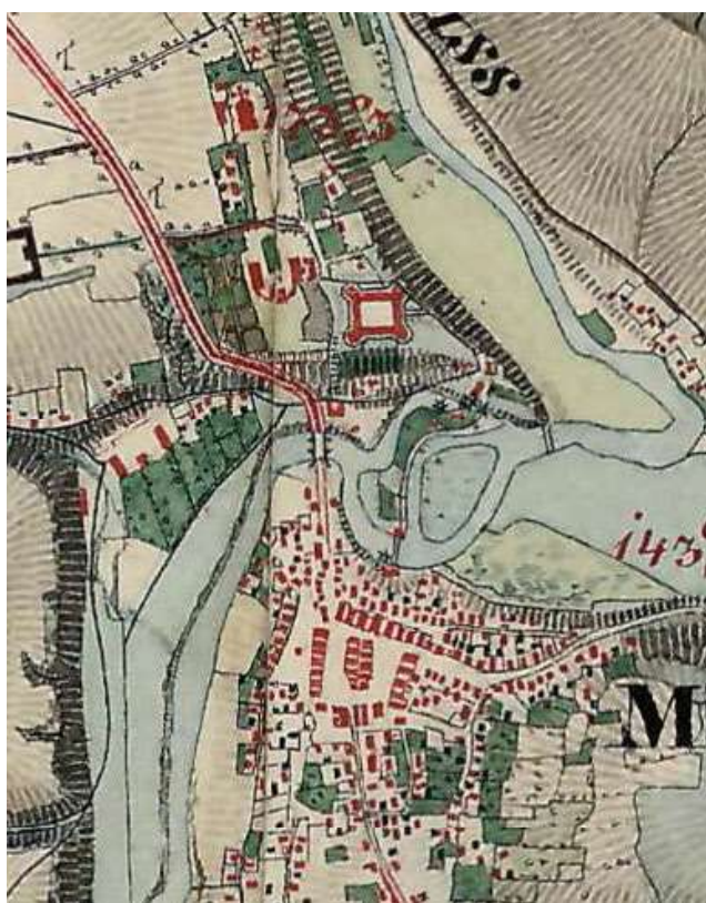
Ryc. 1. Mikulińce. Mapa historyczna (1806 - 1869 r.). Fragment [8].