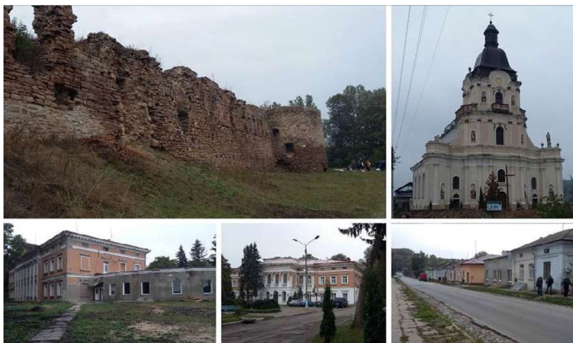
Ryc. 2. Mikulińce. Historyczna zabudowa (2015).

Niestety, balneologiczny szpital Konopki nie wytrzymał konkurencji z uzdrowiskami europejskimi i z uzdrowiskiem w Truskawcu, więc sanatorium później został zamknięty. Pałac był zwykłą siedzibą Konopok, którzy byli jej właścicielami przed II wojną światową. W czasach sowieckich, w pałacie znajdował się Obwodowy Mykulynecki Szpital Fizjoterapeutyczny, jest on tam do dziś.