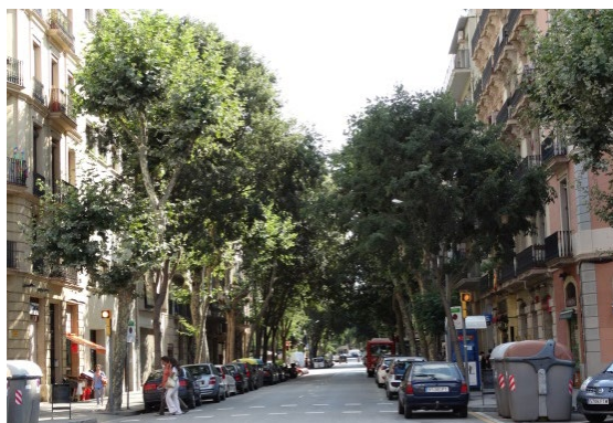
Ryc. 4. Carre de Casp, Barcelona, Hiszpania, autor Wojciech Kocki.