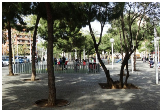
Ryc. 6. Przestrzeń publiczna, Carrer de Pujades, Barcelona, Hiszpania, autor Wojciech Kocki