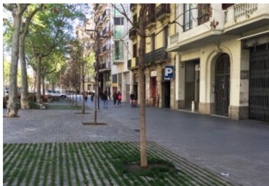
Ryc. 8. Przestrzeń publiczna, ul. Gran via de Les Corts Catalanes, Barcelona, Hiszpania, autor Wojciech Kocki.