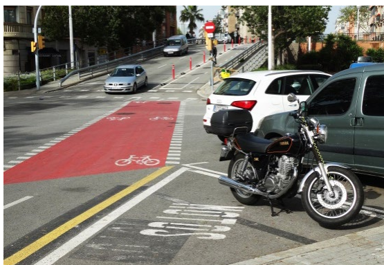
Ryc. 3. Parking dla motocykli, Carrer de Pujades, Barcelona, Hiszpania, autor Wojciech Kocki.

utwardzone z ławkami oraz od kilku do kilkudziesięcioletnimi drzewami wkomponowanymi z przestrzeń chodnika dającymi cień oraz bliski kontakt z zielenią tworzący kameralne wnętrza dla jej użytkowników. Na przykładzie wybranego skrzyżowania można zauważyć jego możliwości adaptacyjny pod kątem parkingów zarówno dla samochodów jak i motocykli. Na zaznaczonych miejscach dla postoju samochodów zmieściłoby się ok. 60 aut i 50 motocykli ryc. 3 jedynie dla tego skrzyżowania w centrum miasta o wysokiej gęstości zabudowy. Poza miejscami postojowymi możemy również wyróżnić wydzielone miejsca dla postoju rowerów, miejsca na kontenery śmieci miejskich, przystanek autobusowy, przejścia dla rowerzystów oraz pieszych jak i wydzielone pasy jezdne dla autobusów oraz taksówek.