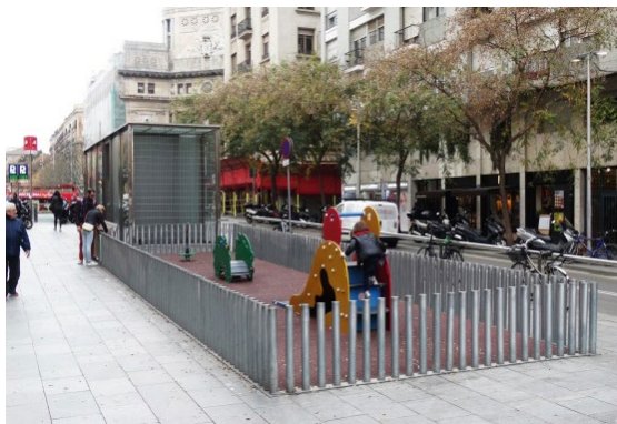
Ryc. 5. Plac zabaw dla dzieci w przestrzeni publicznej ulicy Av. De Francesc Cambo, autor Wojciech Kocki.