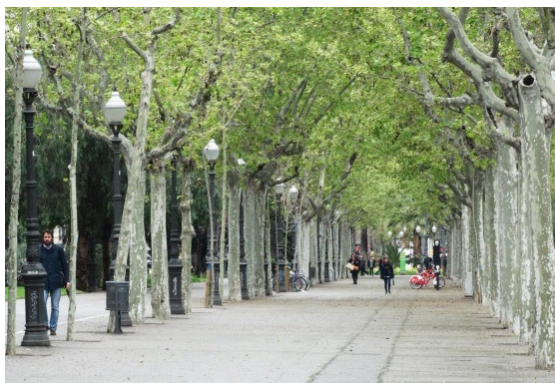
Ryc. 7. de Sant Joan, Barcelona, Hiszpania, autor Wojciech Kocki.