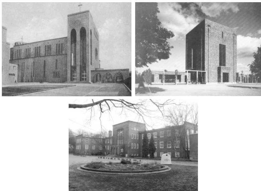
Fot. 11. Kościół pw. Św. Rodziny, ul. Królowej Korony Polskiej, Szczecin (1931), Adolph Thesmacher

Kolejne obiekty charakteryzowała surowa kubiczna bryła, nawiązująca do architektury przemysłowej. W kościele przy ul. Korony Polskiej zastosowano wąskie piono-