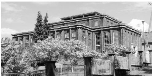
Fot. 7. Budynek przepompowni, ul. Wodociągowa, Pilichowo k. Szczecina

Efekt rozrzeźbienia bryły w elewacjach zewnętrznych budynków przepompowni uzyskano stosując międzyokienne pilastry o przekroju trójkątnym oraz podwójny gzyms nadając wrażenie „rozzedrgania bryły”. W wieży węglowej efekt dynamiczności bryły uzyskano przez wyeksponowanie pionowych elementów konstrukcji, tzw. żyłek. Podobne do siebie budynki miejskich za-