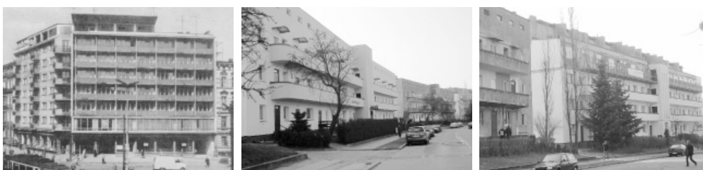
Ryc. 2. Zabudowa zniszczonego centrum (lata 60.), Szczecin

Fot. 18. Zabudowa narożnika ulic Jagiellońskiej i Wojska Polskiego (lata 60.), Szczecin