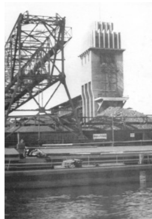
Fot. 3. Miejskie zakłady mięsne, ul.Kraśińskiego, Wilhelm Würffel (1929)