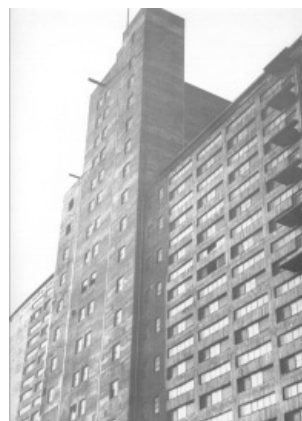
Fot. 14. Budynek magazynowy przy Basenie Zachodnim, na terenie portu, Szczecin (1935)