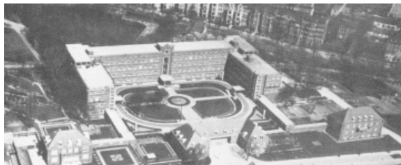
Fot. 10. Szpital, ul. Piotra Skargi, Szczecin (1929-31), Vering i Arthur Walter

Zupełnie odmiennym rozwiązaniem w zakresie strefy wejściowej była klinika dla kobiet. Nowatorsko potraktowano tu detal i bryłę, zbudowaną z trzech skrzydeł, okalających symetryczny dziedziniec wejściowy. Na osi dziedzińca, zlokalizowano wejście główne, podkreślone ryzalitem z pionowym przeszkleniem centralnej klatki schodowej, a w narożnikach skrzydeł bocznych, dodatkowe dwa wejścia, mniej reprezentacyjne, podkreślone również przeszkleniami. Wyraźnie widać wpływy stylistyki szkoły Bauhaus. Potwierdza to sposób zestawiania podstawowych brył obiektu, proporcje okien w stosunku do elewacji, zastosowany detal, przeszklenia naroże, pionowy pasa okienny wejścia i dodatkowo je podkreślający zegar (fot. 10).