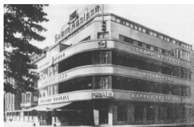
Fot. 8. Kino i dom handlowy „UFA Palast”, Szczecin, ul. Wyzwolenia (1929), Max Bischoff Fot. 9. Kompleks gastronomiczny „Haus Ponath” (nieistniejący), Szczecin (1929)