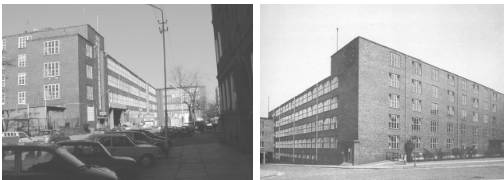
Ryc. 1. Fot. 1-2. Miejska Szkoła Rzemieślników i Rzemiosła Artystycznego, Szczecin, pl. Kilińskiego (1928-30)