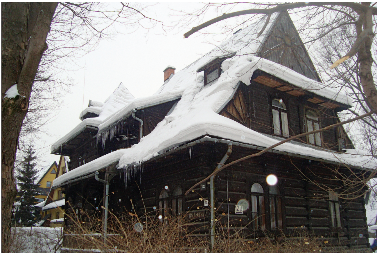
5. Zakopane, styl zakopiański, willa „Bałamutka”, ul. Jagiellońska 6. 5. Zakopane, the Zakopane style, the villa “Bałamutka”, 6 Jagiellońska St.

nobiegowe schody wiodą do głębokiego portyku, który flankują dwie kolumny, nad nim znajduje się obszerny ażurowy balkon. Balkon poddasza wieńczy dach „zakopiański” z wydatnym okapem, łamany z półszczytem górnym z wysoką sterczyną. 9