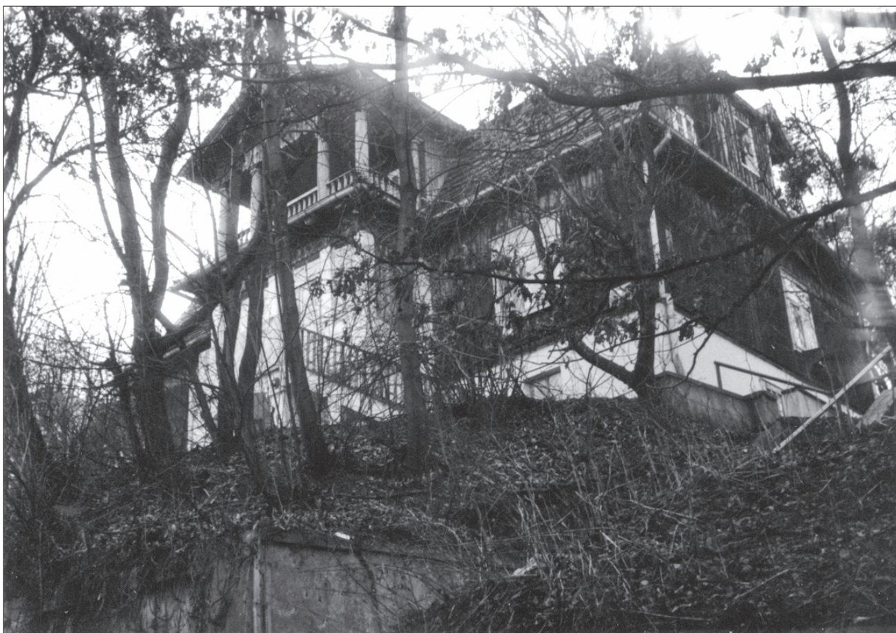
1. Gdynia, styl zakopiański, willa „Orla”, ul. Kasprowicza 2, 1928 r. 1. Gdynia, the Zakopane style, the villa “Orla”, 2 Kasprowicza St, 1928.

Ewolucja form „opływowych” w Polsce zachodziła w trzech etapach. Pierwszym jej stopniem były domy z przeszklonymi narożnikami; drugim – stosowanie linii krzywej w całych elewacjach. Najbardziej rozwinięty, trzeci stopień stanowiły „domy-okręty” zawierające w swych bryłach o zaokrąglonych narożnikach i jasnych elewacjach długie poziomy bulajów, balkonów i tarasów, a także nadbudówki na dachu (często maszynownie wind) stylizowane na „gniazdo kapitańskie” statku.