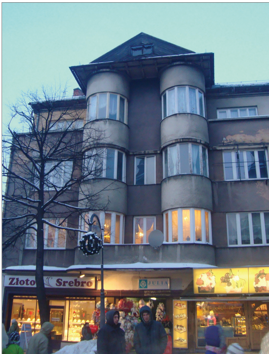
4. Zakopane, funkcjonalizm, kamienica z apteką, ul. Krupówki 35, lata 30. XX w. 4. Zakopane, functionalism, the house with a pharmacy at 35 Krupówki St, 1930s.

a wejście flankowane jest przez okna-światliki. Po wojnie w budynku mieściło się przedszkole, od 1969 r. obiekt był użytkowany przez Automobilklub Morski w Gdyni. 8