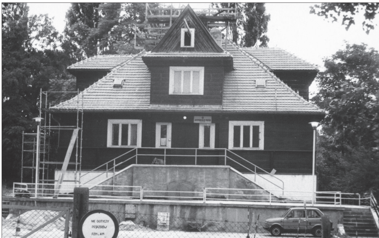
2. Gdynia, styl zakopiański, willa przy ul. I Armii Wojska Polskiego 28. 2. Gdynia, the Zakopane style, the villa at 28 I Armii Wojska Polskiego St.

uksztalowano symetrycznie z werandą parteru na osi, na profilowanej podwalinie w formie nawiązującej do filarów skarp odsuniętych od muru i połączonych od góry łukami odcinkowymi. Na poddaszu weranda przechodzi w balkon o tralkowej balustradzie, który został przekryty dwuspadowym dachem wspartym na sześciu dobrze wyważonych drewnianych kolumnach związanych od góry fryzem gontowych kształtek. Ponad nim znajduje się trójkątny szczyt daszku zwieńczony sterczyną z lukarną. 7