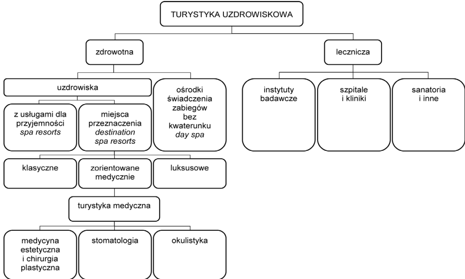
Ryc. 1. Model typów uzdrowisk i ich podział ze względu na świadczone w nich usługi